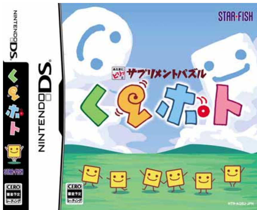
パッケージ画像(実際の商品とは一部異なります)