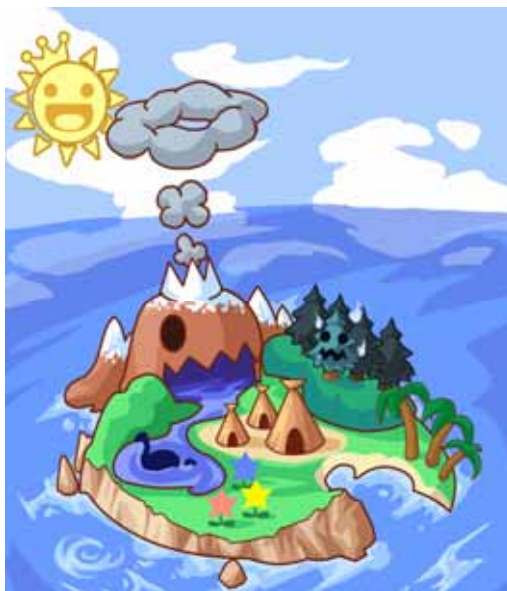
(くるボ島のイメージ)