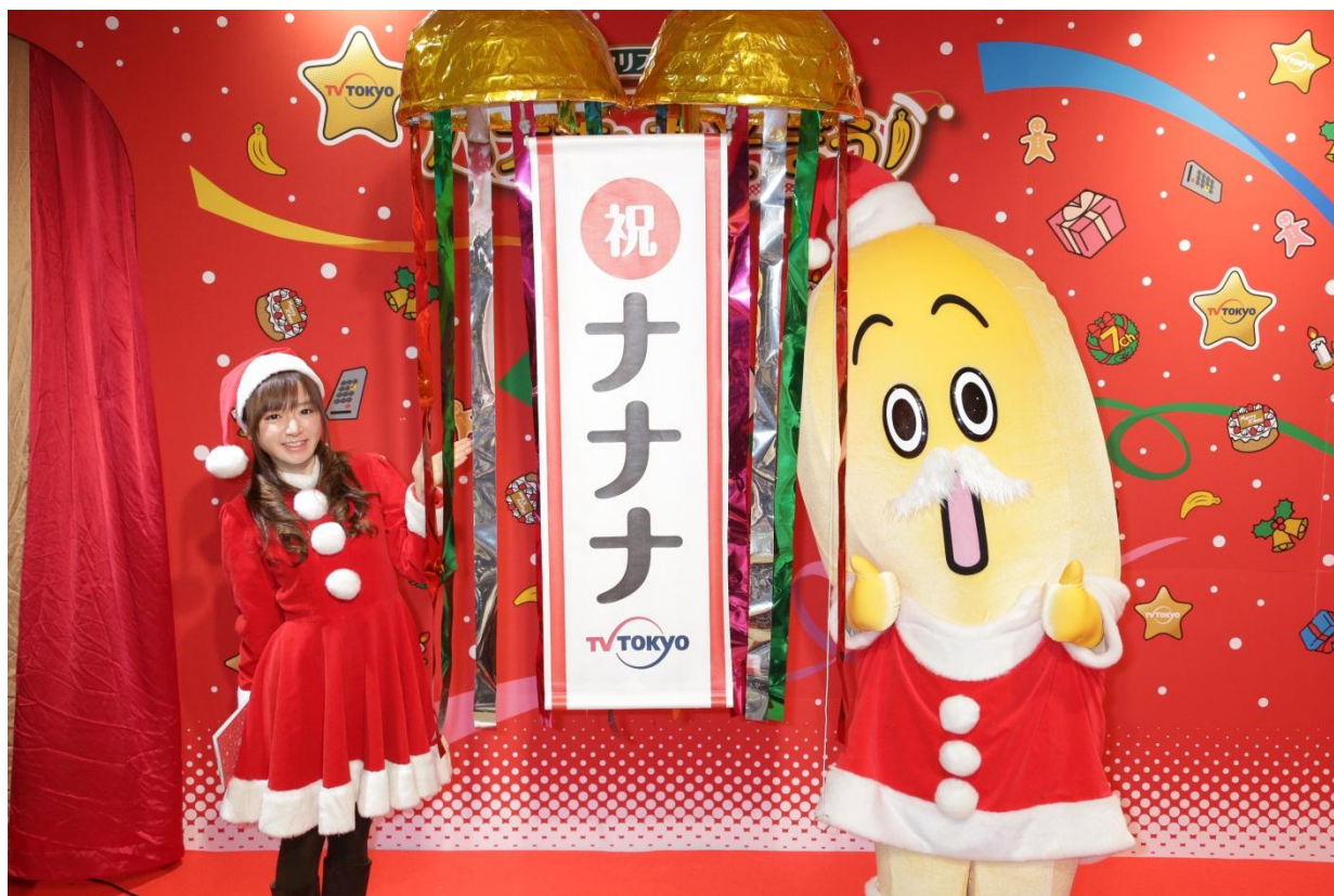
写真左 紺野あさ美(テレビ東京アナウンサー)写真右 ナナナ(テレビ東京バナナ社員)

12月23日、テレビ東京の新キャラクターの名前「ナナナ」が発表となり、それを記念した名前お披露目会見および、お披露目イベント「クリスマスグリーティング バナナと遊ぼう！」が行われました。会場にはたくさんの来場者が詰めかけました。