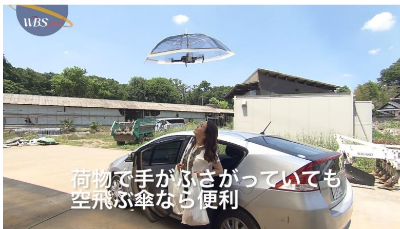
画面イメージ(『WBS』より)