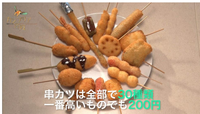
画面イメージ(『カンブリア宮殿』より)

『ガイアの夜明け』『未来世紀ジパング』『カンブリア宮殿』の番組全体を「2分で分かるシリーズ」に再構成して映像と記事を提供します