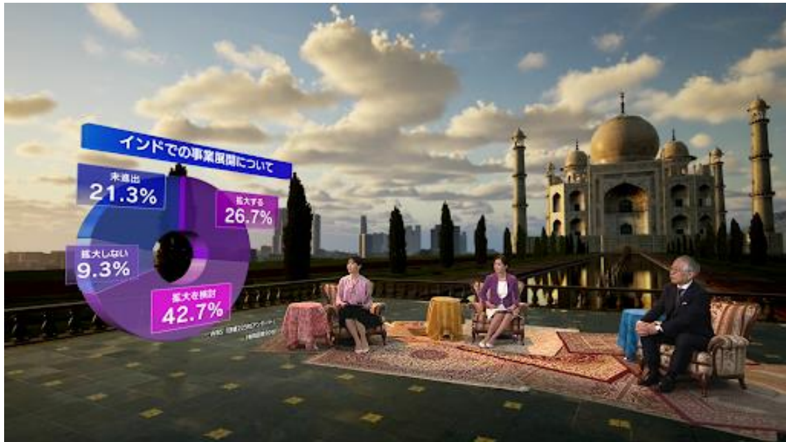
『WBS 拡大版』ではインドを表現した3DCGをVPで背景に(2023年4月放送)

2025年4月までに、テレビ東京の自社スタジオを使って制作する番組の6割にVPを導入していきます。D・A・G社への出資を含め、VP関連への投資額は最大で17億円となります。これにより、制作プロセスやスタジオ運用の効率化を実現するとともに、テレビ東京のコンテンツ制作力とD・A・G社の3DCG技術の相乗効果で、進化を続けるVPを使った魅力的な映像コンテンツを提供していきます。