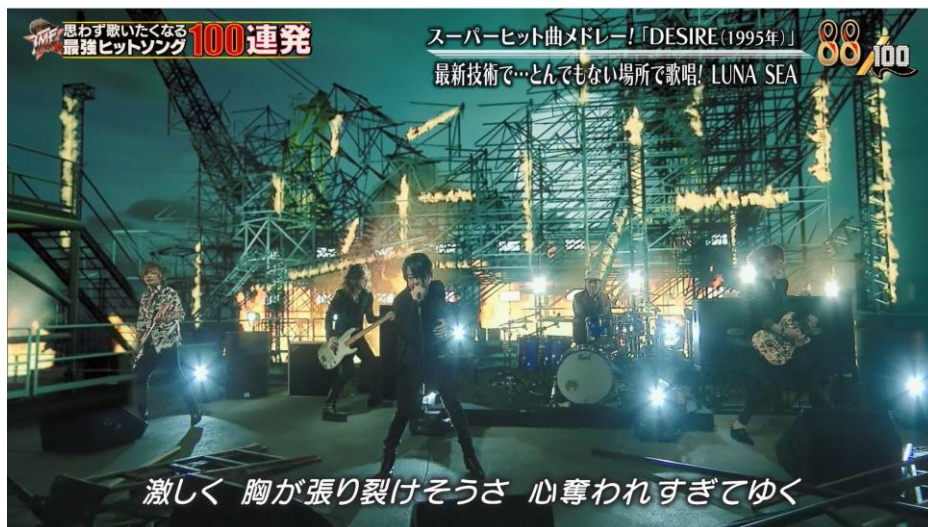
背景の LED ディスプレイに炎の 3DCG (2023年6月放送『テレ東音楽祭』)