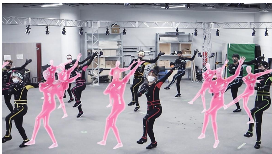
D・A・G 社スタジオでのモーション CG 制作風景

【問い合わせ先】 テレビ東京ホールディングス 広報・IR部 ☎03-3587-3075 E-mail:pr@tv-tokyo.co.jp